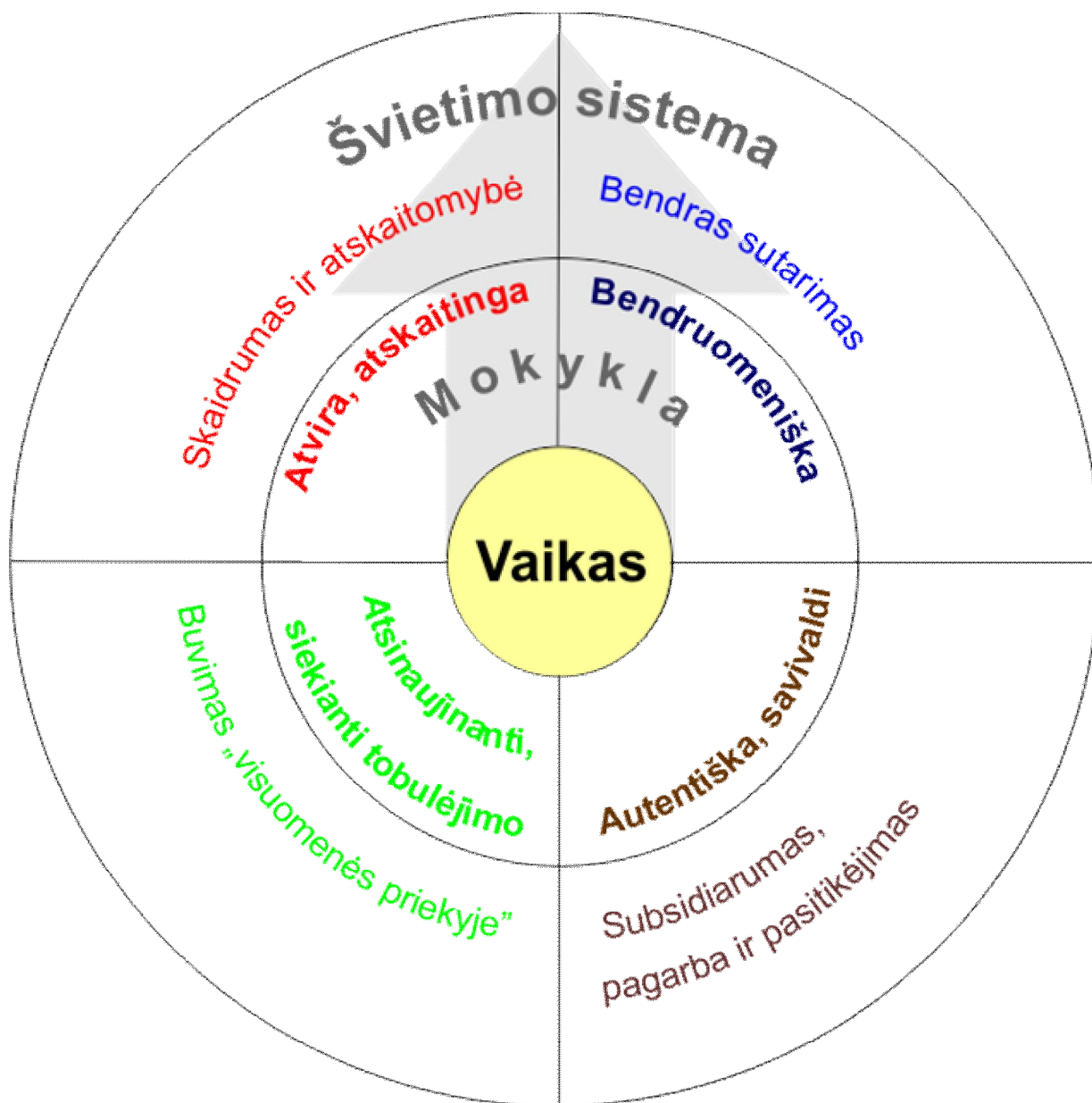
2 schema. Švietimo sistemos principai

Tolesnė vizijos išdėstymo struktūra yra paremta mokyklos vidaus veiksniais, darančiais įtaką mokiniui: mokytojas, bendruomenė, mokyklos valdymas, mokymosi organizavimas, vertinimas ir įšivertinimas. Kiekvienoje dalyje yra išskirta, ko siekiama (tikslai, pagrindiniai principai), ir kaip galima to pasiekti (galimos įgyvendinimo priemonės – ką daryti, kad būtų įgyvendinami numatyti tikslai ir principai).